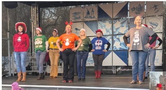
oben: die "Crazy Sheepliner"